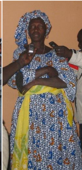
Alunas e mulheres explicando o interesse do mangal