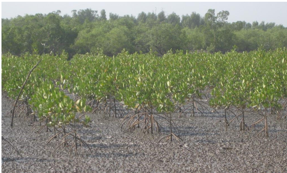
Com o mangal a vida no mar e rias é mais rica e diversificada