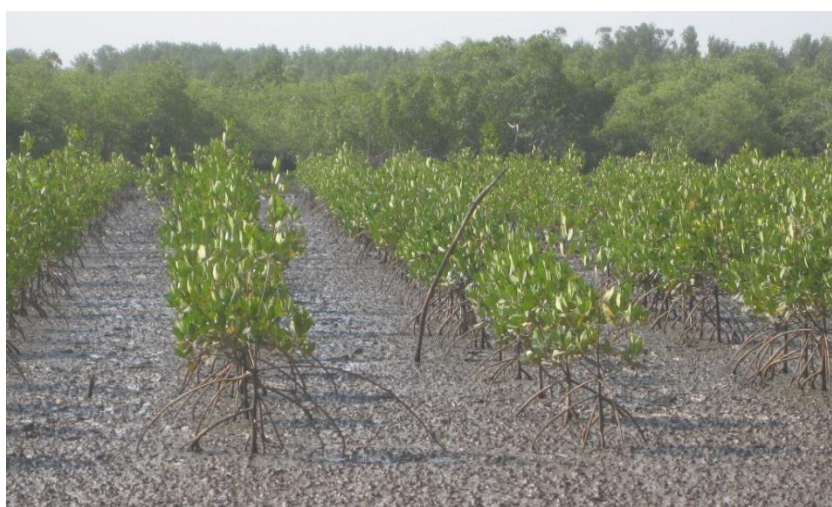
Repovoamento na EVA de Cubampor

Esta Jornada incluiu visitas ao terreno, às zonas repovoadas e a uma sessão em sala para discussão sobre os grandes desafios do Mangal.