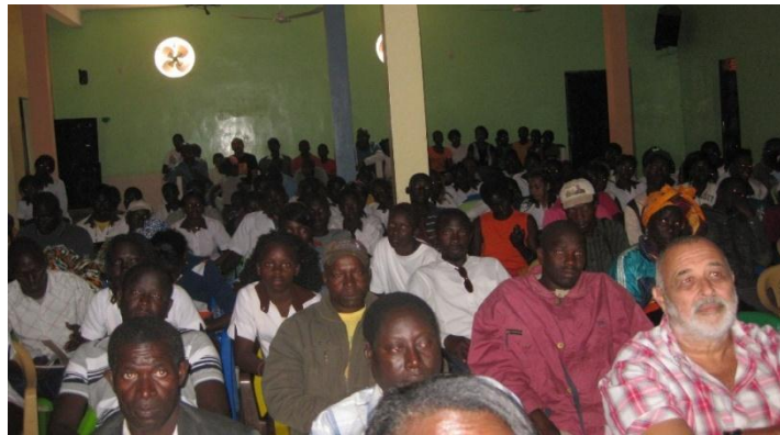
Aspetto da sala com os participantes